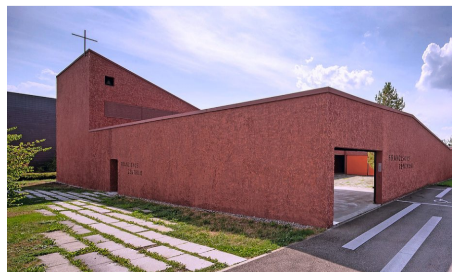
Die St.-Franziskus-Kirche in Uetikon am See.

Das zweibändige Buch «Sakrales Zürich – 150 Jahre katholischer Kirchenbau im Kanton Zürich» erfasst erstmals systematisch die ganze Zürcher Kirchenlandschaft – und zwar in chronologischer Abfolge. Die grossformatigen Farbbilder stammen vom Fotografen Stephan Kölliker, die Texte vom Germanisten und Priester Markus Weber. Vor fünf Jahren hatte er angefangen, Wikipedia-Artikel zu den katholischen Kirchen zu veröffentlichen. Bisher hat er es auf 227 Einträge gebracht. Mittelschullehrer Weber ist auch Seelsorger in Dübendorf und hat ein klar theologisches Interesse. «Der Mensch braucht Gott», schiebt er